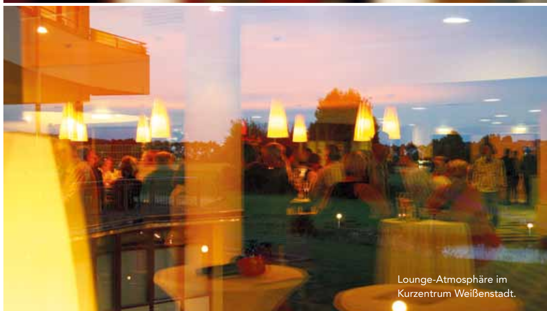
Lounge-Atmosphäre im Kurzentrum Weißenstadt.